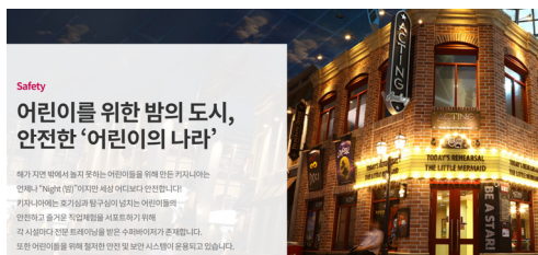
그림 2 키자니아의 직업 체험 홍보 문구 및 이미지 출처: 키자니아 공식 홈페이지, 2026.

지리적 장소는 텅 빈 자연적 공간이 아니라, 그곳에 거주하는 이들의 땀과 노동, 인격적 행위가 켜켜이 침전(Sédimentation)된 ‘문화적 세계’이자 ‘사회적 세계’이다(PP:638). 따라서 현장체험학습은 단순히 물리적 지형을 확인하는 것을 넘어, 그 장소에 깃든 역명의 타인들과 실존적으로 조우하는 사건이어야 한다. 그러나 현행 초등 지리 교육은 학생들을 안전하고 통제된 관찰자의 위치에