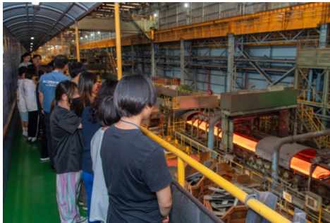
그림 4. 지역 공장 견학의 예

에서 학생들은 장소를 관찰하는 대신 장소를 ‘살아내며’, 그 과정에서 공간은 텅 빈 상자의 껍데기를 벗고 인간의 숨결이 박동하는 진정한 삶의 터전으로 피어난다.