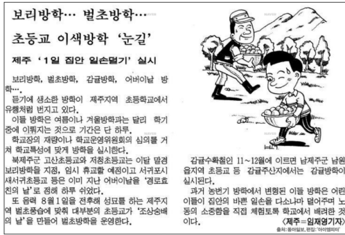
그림 3. 대지에 뿌리내리는 삶으로서의 현장체험학습(제주 감귤 방학)의 예