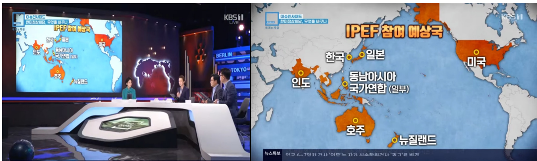
그림 3. KBS <특파원 보고 세계는 지금>에서 소개한 IPEF 지도

한국은 경제뿐 아니라 문화·예술 등 다양한 분야에서 국제 사회의 인정을 받고 있으며, 제2차 세계 대전과 한국전쟁 이후 빈민국에서 선진국으로 전환한 드문 사례로서 국제적 영향력을 확대해 나가고 있다. 그러나 국경에 갇힌 평면적 사고와 서구 중심주의로 왜곡된 세계 인식, 단순화된 세계 지도에 의존해서는 고차원적으로 전개되는 국제 이슈를 효과적으로 이해하기 어렵다(김이재, 2021a; 야노 토루, 1999). ‘외교는 국익을 지키는 마지노선’이라는 외교부 장관의 강조에도 불구하고(연합뉴