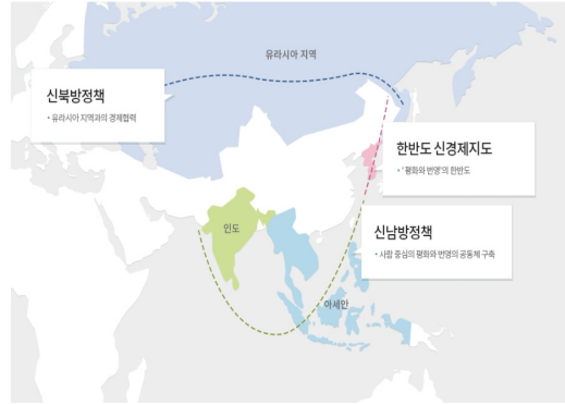
그림 2. 한국의 외교정책 대상지역 지도(외교부, 2019)

로바키아 등은 서쪽 기점을 더욱 동쪽으로 이동시켜 파키스탄에서 태평양 도서국까지로 범위를 한정하고 있다. 이들 국가는 아프리카와 중동을 범위에서 제외함으로써 자국의 무역 이익이 집중된 동남아시아와 동북아시아 해상 회랑에 정책 역량을 집중하는 ‘선택적 지리 확장’의 특징을 보인다. EU가 공식적으로 ‘아프리카 동해안에서 태평양 섬 국가들까지’라는 범위를 제시하고 있음에도 불구하고, 27개 회원국의 실제 인식과 참여 의지는 국가별로 다양한 양상으로 분화되어 있다.