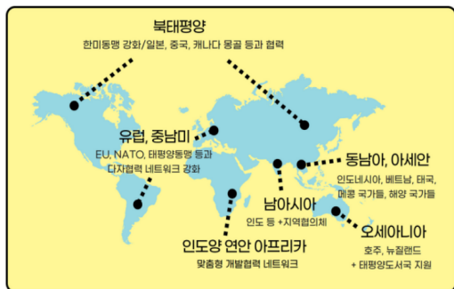
그림 5. 외교부 블로그의 인도-태평양 전략 지도

지리적 문해력은 더 이상 선택적 교양이 아니라 외교정책의 실효성과 국가 경쟁력을 좌우하는 핵심 기반이다(de Blij, 2012; Murphy, 2018). 즉, 지리는 더 이상 단순한 배경 지식에 머물지 않고 지정학·외교·안보를 이해하는